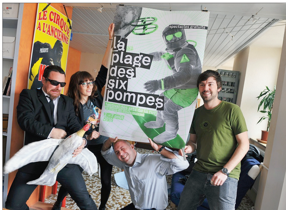
NOUVELLE AFFICHE Fidèles à eux-mêmes, c'est avec humour et décontraction que le comité d'organisation de la Plage des Six-Pompes et l'agence Supero ont présenté l'affiche de la 17e édition.

2010, a été réalisée par Jennifer Sunier et Samuel Perroud, de l'agence Supero à La Chaux-de-Fonds. Elle allie décors futuristes et accessoires de plage, le tout dans la couleur tendance des aliens... le vert fluo.