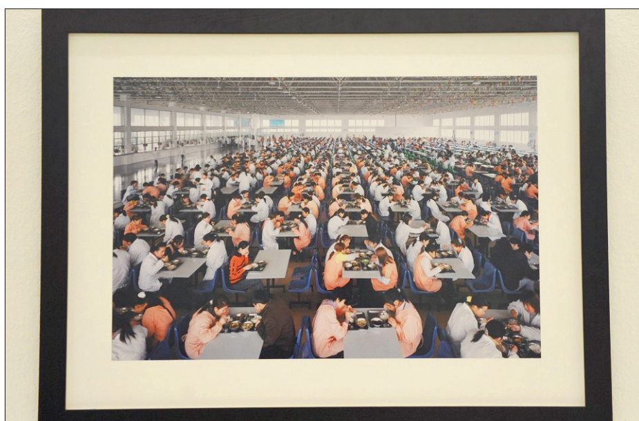
INDUSTRIE Regard sur l'industrie dans trois musées du haut du canton. Ici, une œuvre présentée au Locle pour l'exposition «Les visages de l'industrie».

Espace de l'urbanisme horloger (entrée libre): La Chaux-de-Fonds; rue Jaquet-Droz 23. Tous les jours de 10h à 12h et de 13h à 16 heures