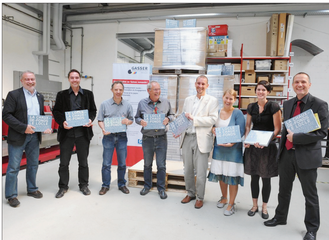
UNESCO Les représentants des deux villes et l'équipe de candidature Unesco étaient réunis hier dans les locaux de l'entreprise Gasser, au Locle, où a été imprimée et éditée la version «light» du dossier.